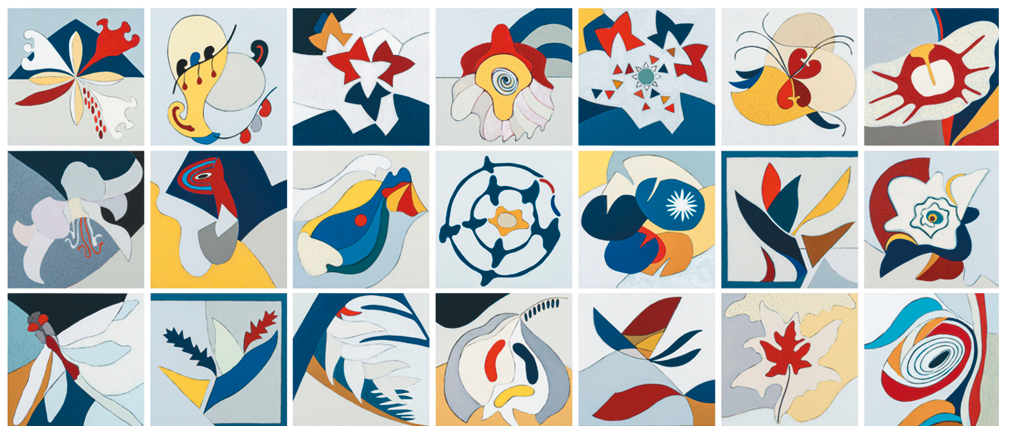
De la sierra al mar 2017 21 Óleos sobre tela | 30x30 cm. cada uno.

SN Macarena es una sala de proyectos que promueve artistas regionales, nacionales e internacionales que se destaquen por el rigor en el oficio y la excelencia en el manejo de la técnica.