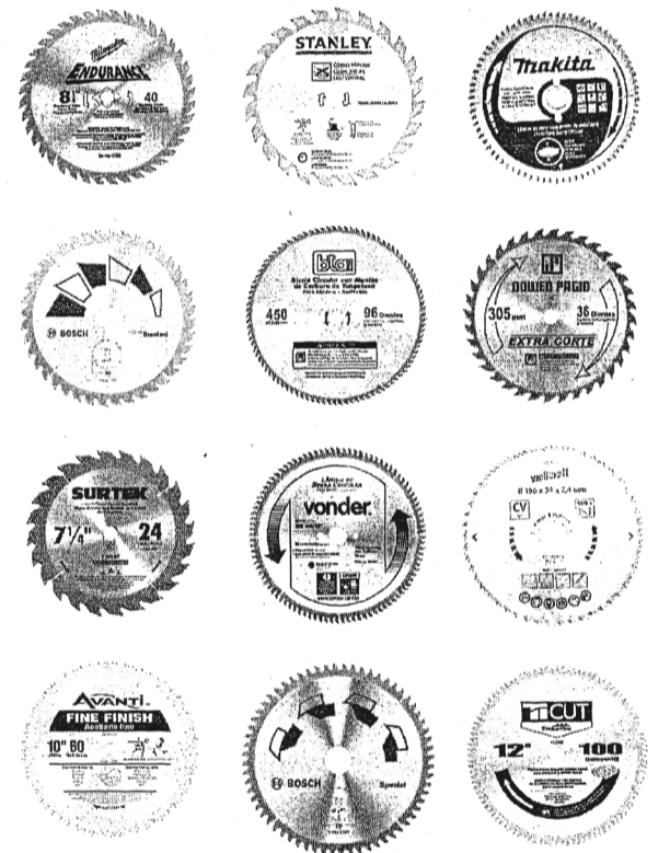
Carlos Velásquez | Sin Título Serigrafía sobre cartón

El equipo de arqueólogos se aventuró a examinar las piezas antiguas y aunque han ofrecido varias explicaciones para el uso y la forma de los objetos, el asombro se apoderó de todos.