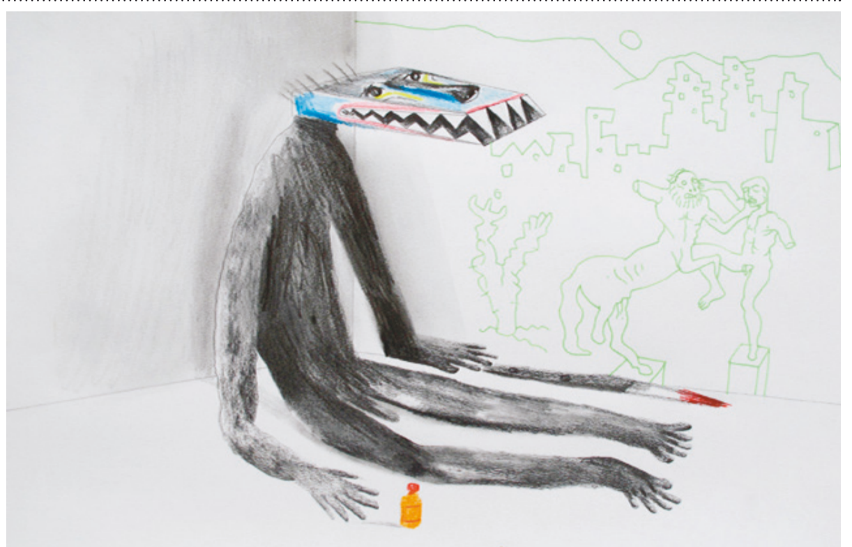
Miguel Cárdenas | Proyecto para escultura "El Projimo" Lápiz y tinta sobre papel 2018. 42 x 30 cms.

Los talladores de piedra se alistaron a darle forma a un enorme bloque de granito. Alguien había medido cuidadosamente los ángulos; todo tenía que ser hecho a la perfección. Un golpe muy duro y la roca podría desportillarse, un ángulo mal medido y la figura sería imperfecta.