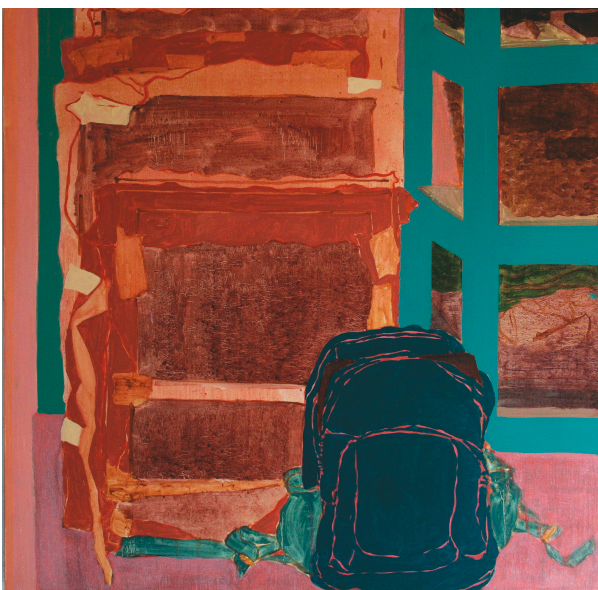
De la serie "The things" - 2013 | Óleo y acrílico sobre lienzo | 100 x 100 cm

plantas que sus vecinos cuidan —como ella también lo hace— y crecen a su aleatorio antojo buscando la luz y el aire húmedo junto a rejas y ventanas ( Empatía anónima ). Los diagramas, aún en su tediosa expectativa de perfección, también pueden ser algo torcidos, algo sucios, algo inútiles ( Días laborales ). Priman las estructuras de lo visible, pero no son su elemental representación, que podría fácilmente sostener en una rutina institucionalizada. Se revela lo que puede estar fuera del orden: una huella de gato sobre la tela, un inesperado color lila, un grumo o un chorreado, un par de eternas flores