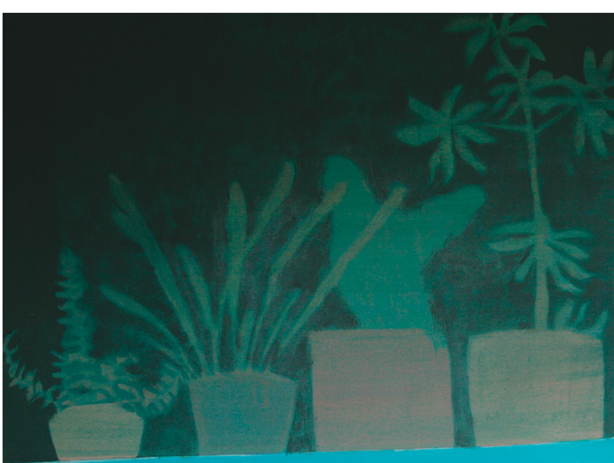
De la serie "Empatía Anónima" - 2014 | Óleo sobre lienzo | 60x80 cms.