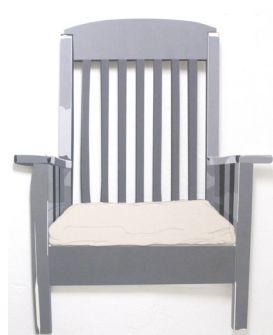
Poltrona en madera 114 cm X 92 cm Dibujo en grafito, lápiz grueso y acrílico sobre madera aglomerada Mdf 2017