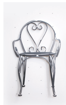
Silla jardín 95 cm X 60 cm Dibujo en grafito, lápiz grueso y acrílico sobre madera aglomerada Mdf 2018