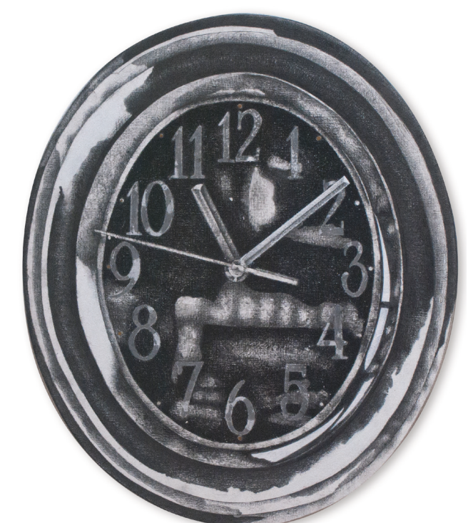
Reloj | 2018 | 31 cm X 26 cm | Dibujo en grafito, lápiz grueso y acrílico sobre madera aglomerada Mdf.