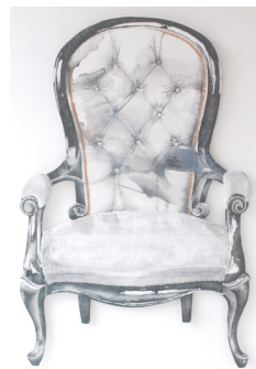
Silla Isabelina 117 cm X 75 cm Dibujo en grafito, lápiz grueso y acrílico sobre madera aglomerada Mdf 2012