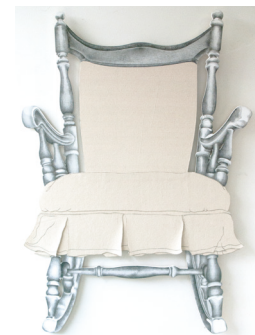
Mecedora 111 cm X 77 cm Dibujo en grafito, lápiz grueso y acrílico sobre madera aglomerada Mdf 2018