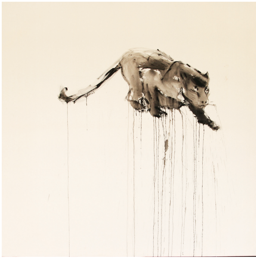
Pantera - 2019