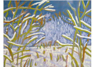
Sugar Hill en verde y azul Oleo sobre madera 30x40 cm 2022