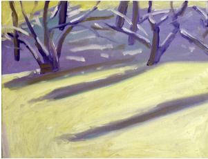
Dawn Oleo sobre lienzo 30 x 40 cm 2022