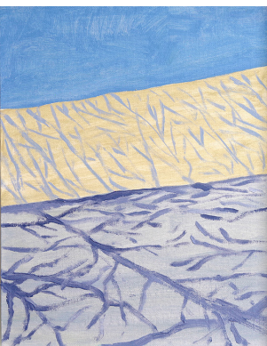
Snow Bank oleo sobre lienzo 35,5x27,5 cm. 2022