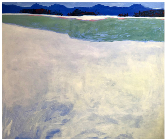
Lago Oleo sobre lienzo 130x150 cm 2022