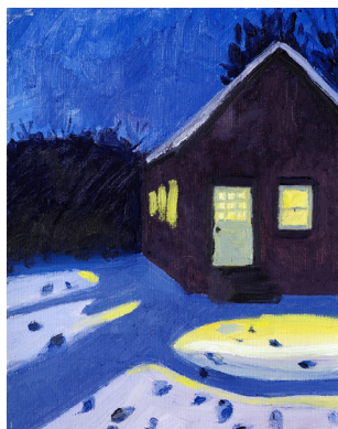
Noche Oleo sobre papel 30,5x23 cm 2022