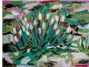
Snowdrops Oleo sobre lienzo 30x40 cm 2022